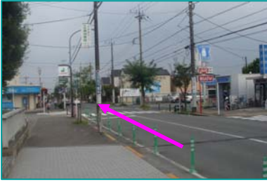
① つきみ野駅改札を出て左へ