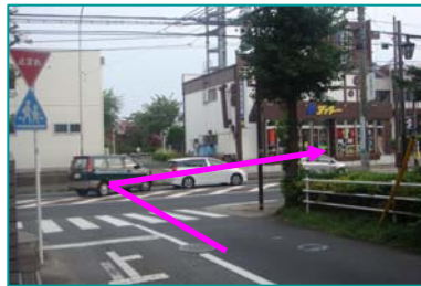
⑤ 座間街道変形十字路を 右折します