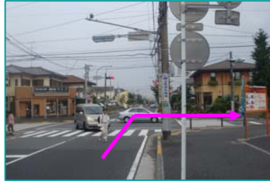
② つきみ野三丁目交差点を 右折します