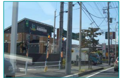
⑥ 左手に当院があります