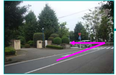
③ 大和高校正門前T字路を 左折します